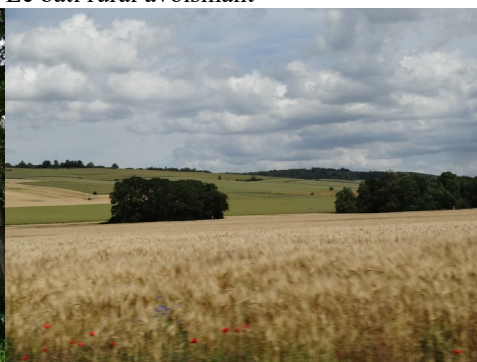
Les plaines et collines cultivées