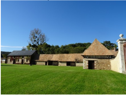
La cour enherbée du manoir