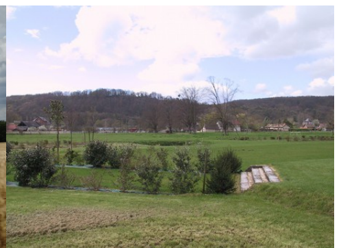
Les prairies et le village de Cailly