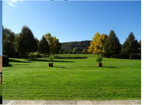
La vue vers l'Eure et ses côteaues boisés

Pour la zone en rose foncé dans le périmètre de 500m