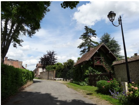
Une rue de Cailly

Les avis seront cohérents avec ceux émis ces dernières années, à savoir : pas de maisons à volume compliqué (type V, W, Y, ou Z), pentes à 45° pour les volumes principaux, ardoise ou tuile plate de teinte brun vieilli, à 20u/m 2 , avec un débord de toiture de 20cm, enduit de teinte beige clair avec modénatures (au choix : chaînages, encadrement de fenêtres, soubassement, colombage...). *Voir les autres fiches.