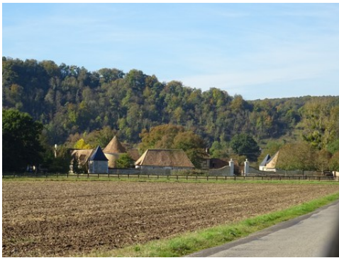
Le manoir vu depuis la route à l'Est