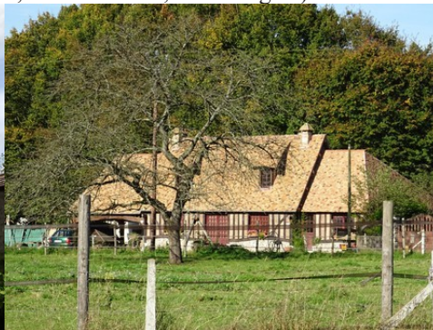
Le bâti rural avoisinant