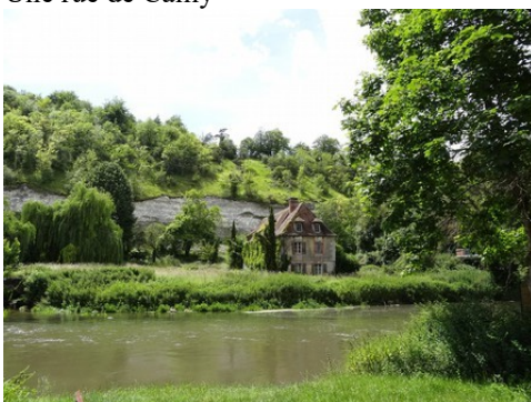
La rivière d'Eure et ses côteaues