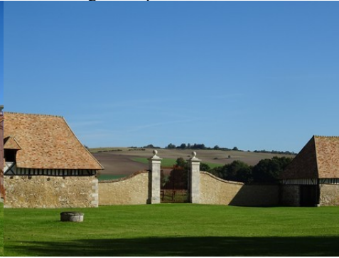
La vue vers les collines cultivées à l'Est