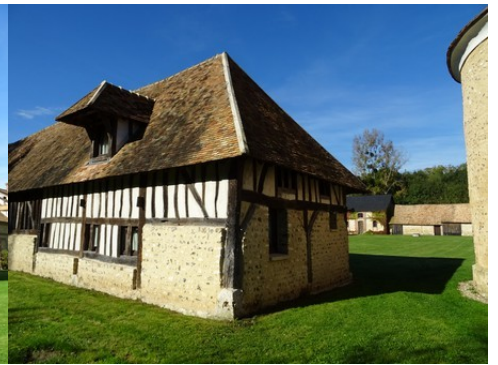
Une ancienne grange