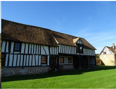
L'ancien logis d'exploitation du domaine